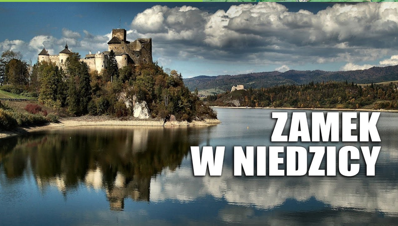
ZAMEK W NIEDZICY