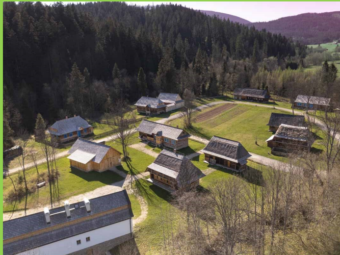
Orawski Park Etnograficzny